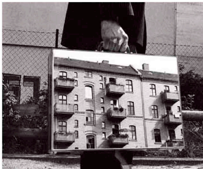
Rui Alçada Bastos The Mirror Suitcase Man #1, 2004