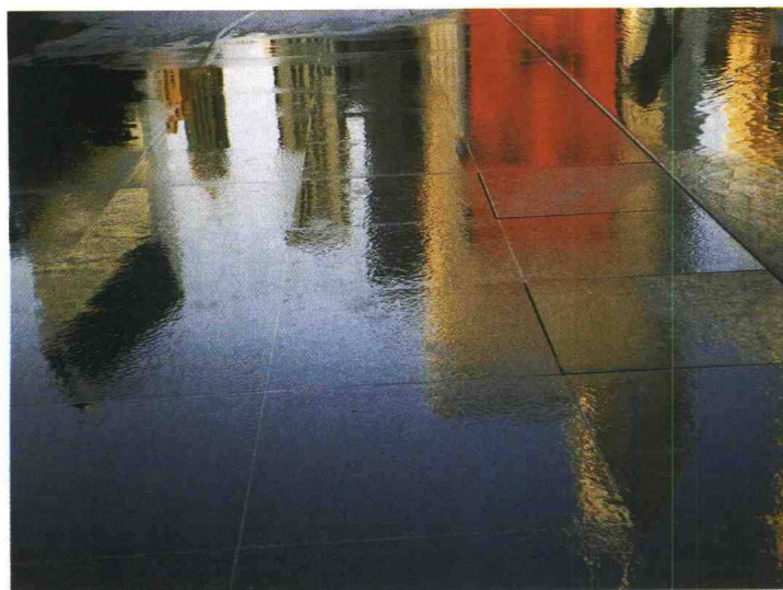
Chicago I A fotografia de Beatriz Albuquerque